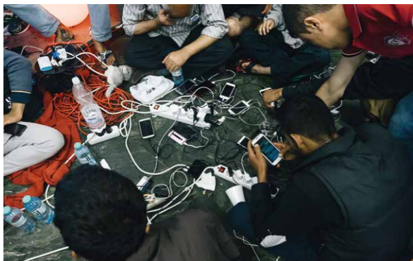
Florian Rainer, Fluchtwege | Escapes , 2015, Farbfoto, Pigmentprint | colour photograph, pigment print

„Looking for the Clouds“ spannt zeitlich und thematisch einen Bogen vom 11. September 2001 mit seinen tragischen Ereignissen in New York bis herauf in das Jahr 2015, das sich uns allen als Höhepunkt einer beispielelosen, erzwungenen, enormen Migration eingeprägt hat. Die Ausstellung stellt Foto- und Videoarbeiten internationaler KünstlerInnen und FotojournalistInnen vor, um die Geschichte der letzten 15 Jahre unter diesem Aspekt zu beleuchten. Dabei war 9/11 nur der Ausgangspunkt für einen tiefgreifenden strukturellen Wandel, den unsere Gesellschaft seither erlebt und der uns extremen Situationen, die einander bedingen, aussetzt: Eine nahezu komplette Überwachung des öffentlichen und privaten Raumes, kriegsbedingte Flucht nach und innerhalb Europas sowie eine nachhaltige Definitionsverschiebung des Begriffs „Identität“ stellen althergebrachte Lebensmuster langfristig in Frage.